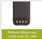
Batterie lithium-ion (1500 mAh) BL1504