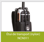
Étui de transport (nylon) NCN011