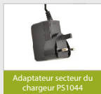
Adaptateur secteur du chargeur P51044