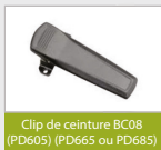
Clip de ceinture BC08 (PD605) (PD665 ou PD685)