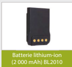
Batterie lithium-ion (2000 mAh) BL2010