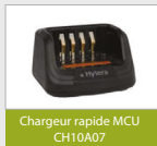
Chargeur rapide MCU CH10A07