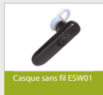
Casque sans fil ESW01