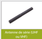
Antenne de série (UHF ou VHF)