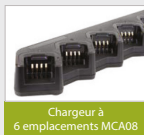
Chargeur à 6 emplacements MCA08